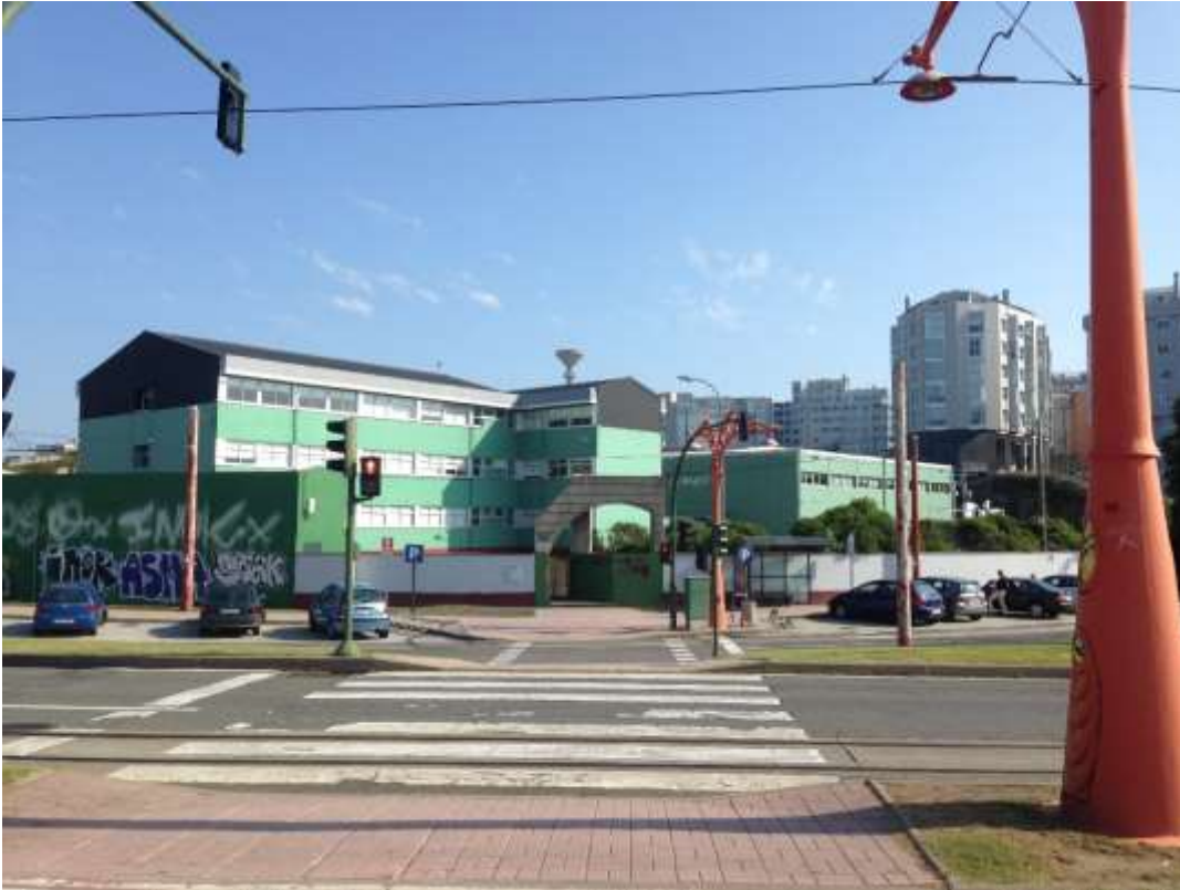
Koulu sijaitsi ihan meren rannalla, alla kuva koululta päin otettuna: