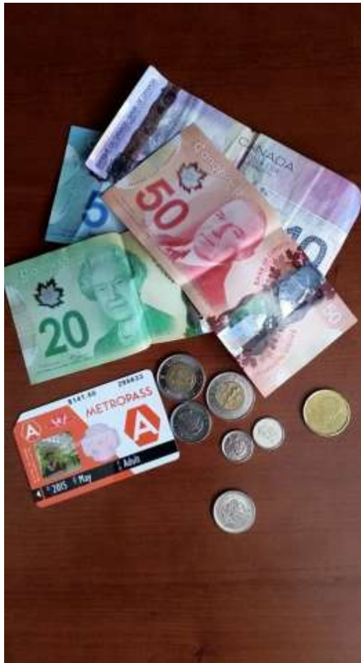
Metropass + paikallista valuuttaa

c) Asuntomme oli host-perheemme omakotitalo. Vuokraan kuului majoitus, ruoka, vesi, internet yhteys, sähkö ym. Keittiö ja muut varustelut olivat vapaassa käytössä koko kuukauden ajan.