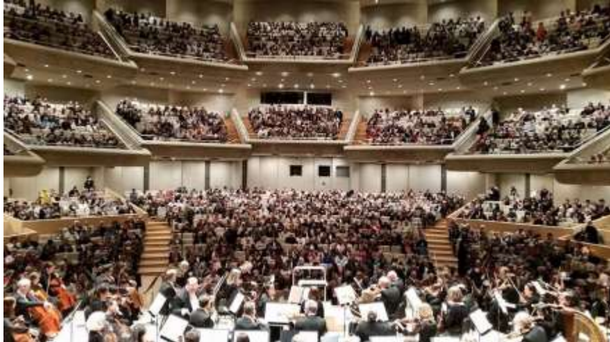
Toronto Symphony Orchestra Felix Mendelssohn Violin Concerto