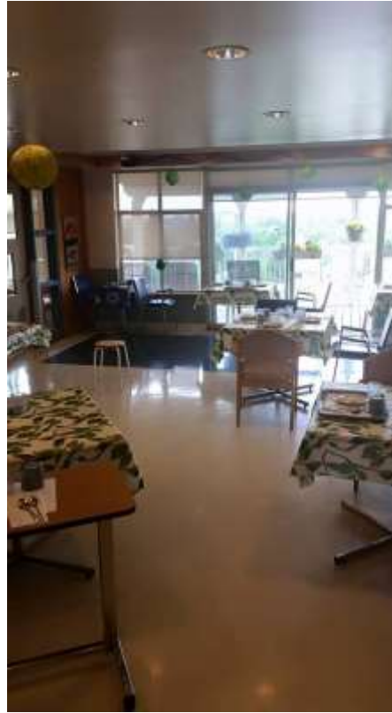
Oik. hoivaosaston ruokasali