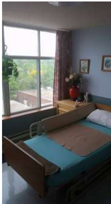
Asukashuone Suomi-Kodin hoivaosastolla