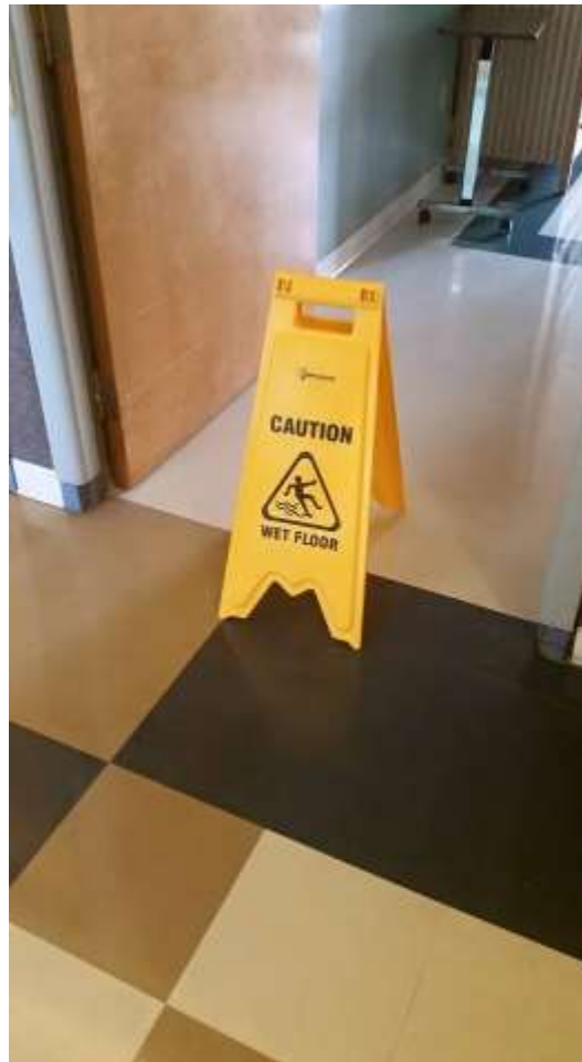
Elokuvistakin tuttu kyltti varoittamassa juuri pestystä lattiasta Suomi-Kodin hoivaosastolla

Joka paikassa oli aina vapaaehtoisia työntekijöitä. Niin myös Suomi-Kodilla. Ajoittain siellä saattoi olla jopa 10 vapaaehtoista, jotka pitivät asukkaille erilaisia virikeohjelmia ja tuokioita. Hoitajat keskittyivät vain hoitotyön toteuttamiseen. Kanadalaiseen kulttuuriin kuuluu hyvin suurena osana vapaaehtoistyö. Jopa eläintarhassa pongasimme vapaaehtoisten rekry/koulutuskeskuksen eläintarhaan tulleille vapaaehtoisille.