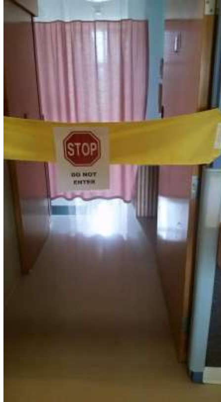
ESBL huone hoivaosastolla