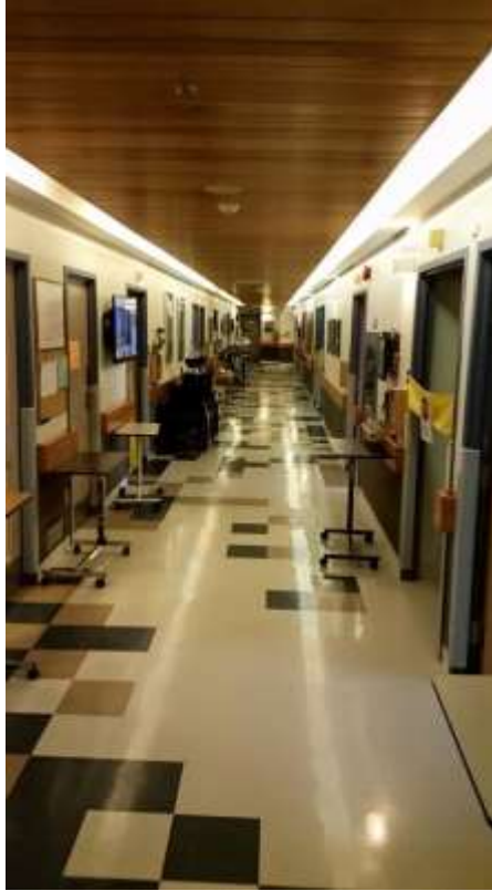
Vas. hoivaosaston käytävä