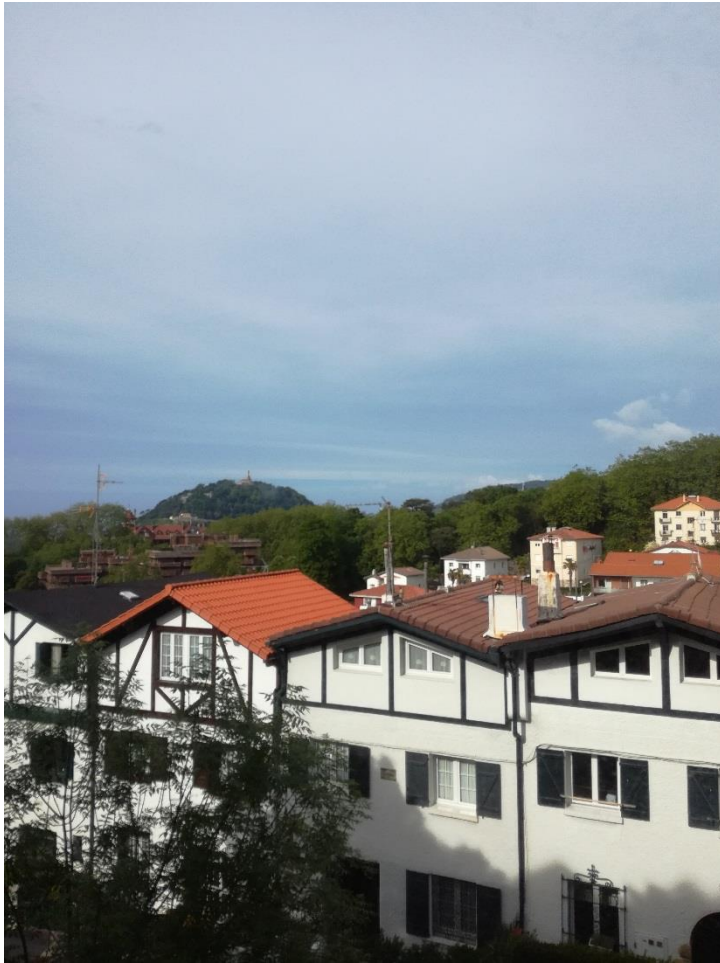
Näköala yhdestä huoneesta

Hintatasoltaan San Sebastian on kuulemma Espanjan kallein, tai ainakin elämiseen mm. talon ostaminen, puhelin- ja vesilaskut ovat kuulemma kalliita. Minun vuokra ei ollut omasta mielestä ollenkaan paha 300€/kk. Siihen sisältyi myös vesi, sähkö ja wifi. Saimme käyttää kaikkia pannuja ja astioita keittiössä sekä pesukonetta. Vuokran maksoin heti kuun alusta vaikka olivat tottuneet saamaan sen vasta kuun lopusta, mutta koin järkevämmäksi vaihtoehdoksi maksaa vuokran heti. Asunnon säännöt olivat normaalit esim. pidä paikat puhtaana, siivoa sotkut ja ilmoitimme vuokraemännälle jos olimme myöhään ulkona.