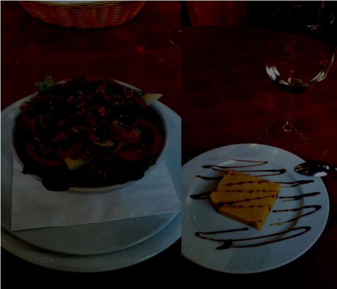
Tonnikalasalaattia ja mangovanukasta.