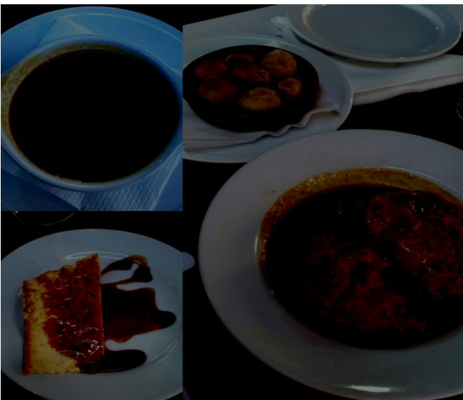
Paikallista ruokaa kanarialaisittain.