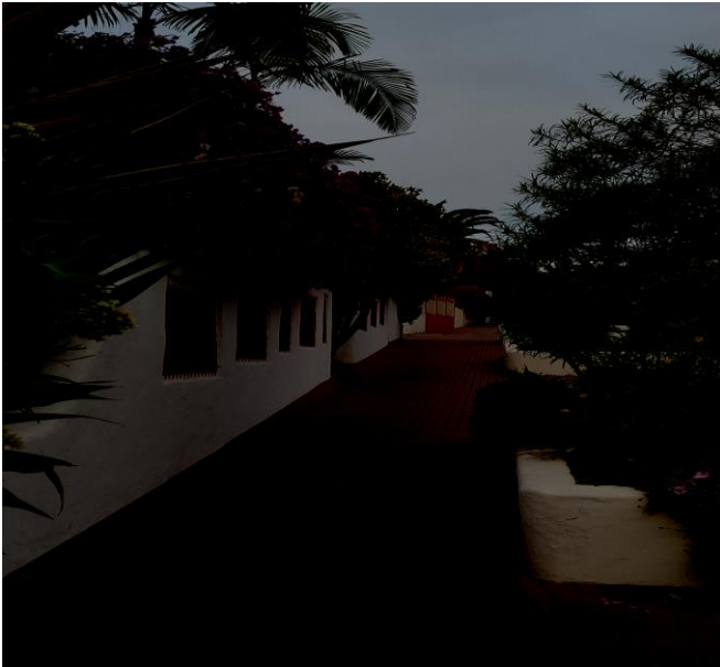
Kävelylenkillä bongattu viehättävä kuja.